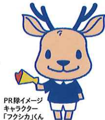
PR隊イメージキャラクター「フクシカくん」

「なりたい職業」と言ってもらえるよう、福祉・介護の仕事の魅力ややりがいをアピールするため、知事が委嘱した「奈良県福祉・介護のお仕事PR隊」が福祉・介護の仕事への思いを語ります。